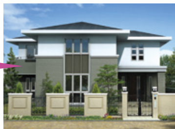
サイディング材を使用した住宅